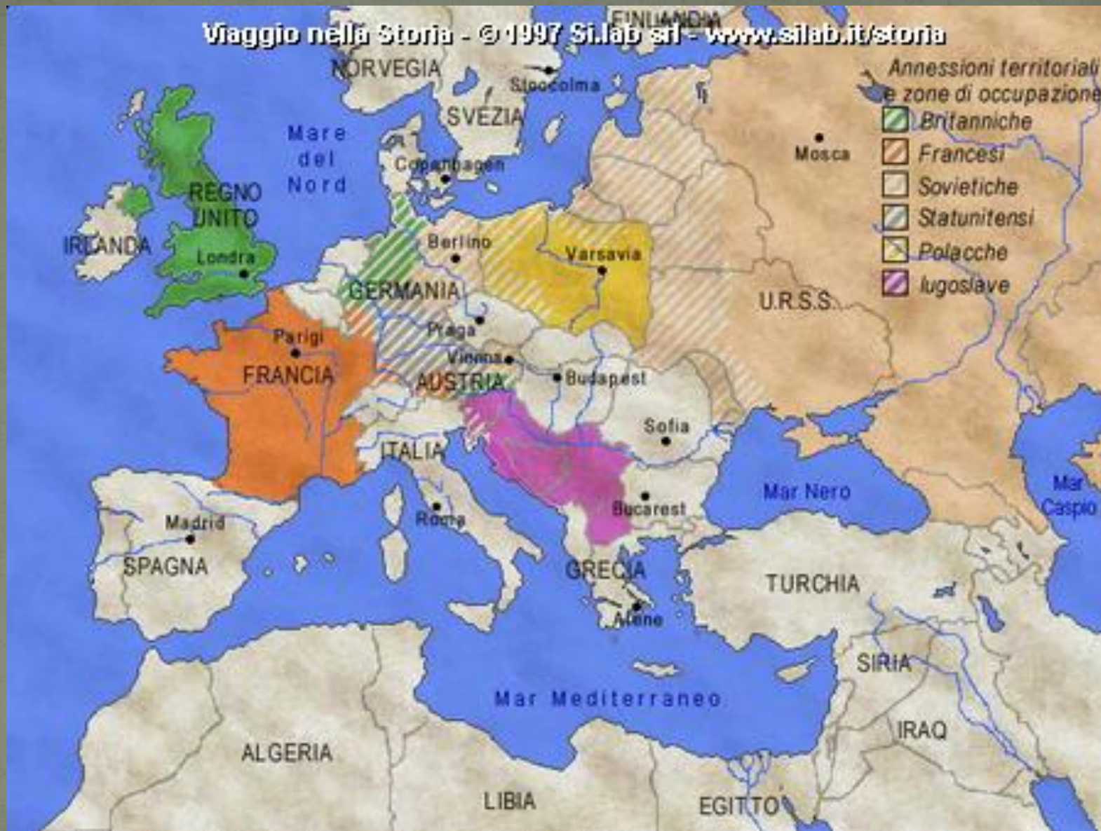
Spartizione della Germania ed espansione dell'URSS