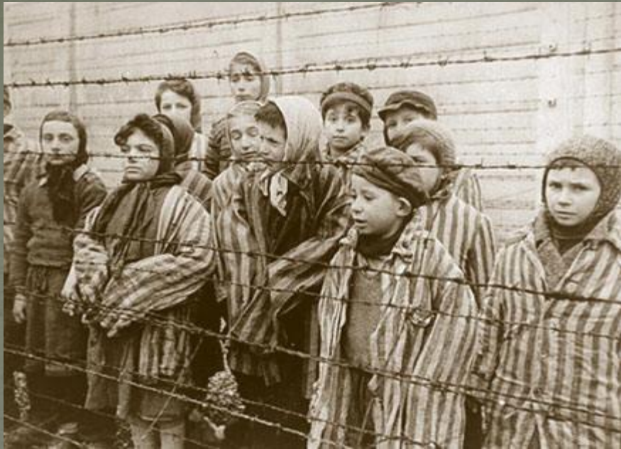
Il campo di Auschwitz