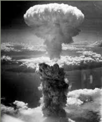
La bomba atomica su Nagasaki